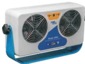
Small Footprint Bracket