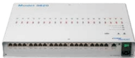
Model 5820 监测系统 离子平衡, 电源异常警报