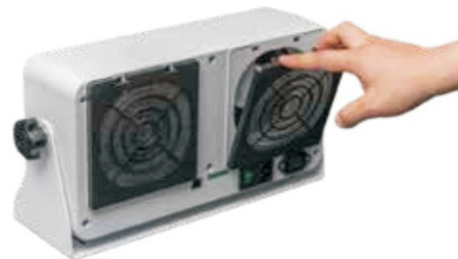
Easy Emitter Point Cleaning and Replacement